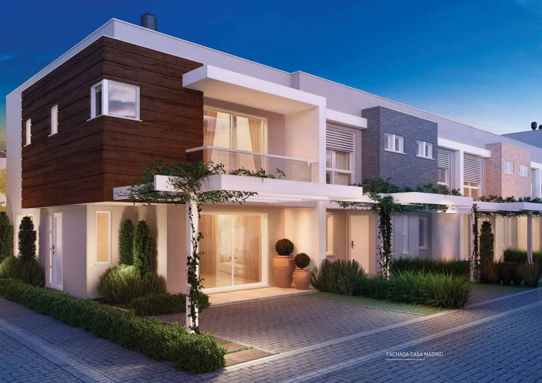
FACHADA CASA MADRID