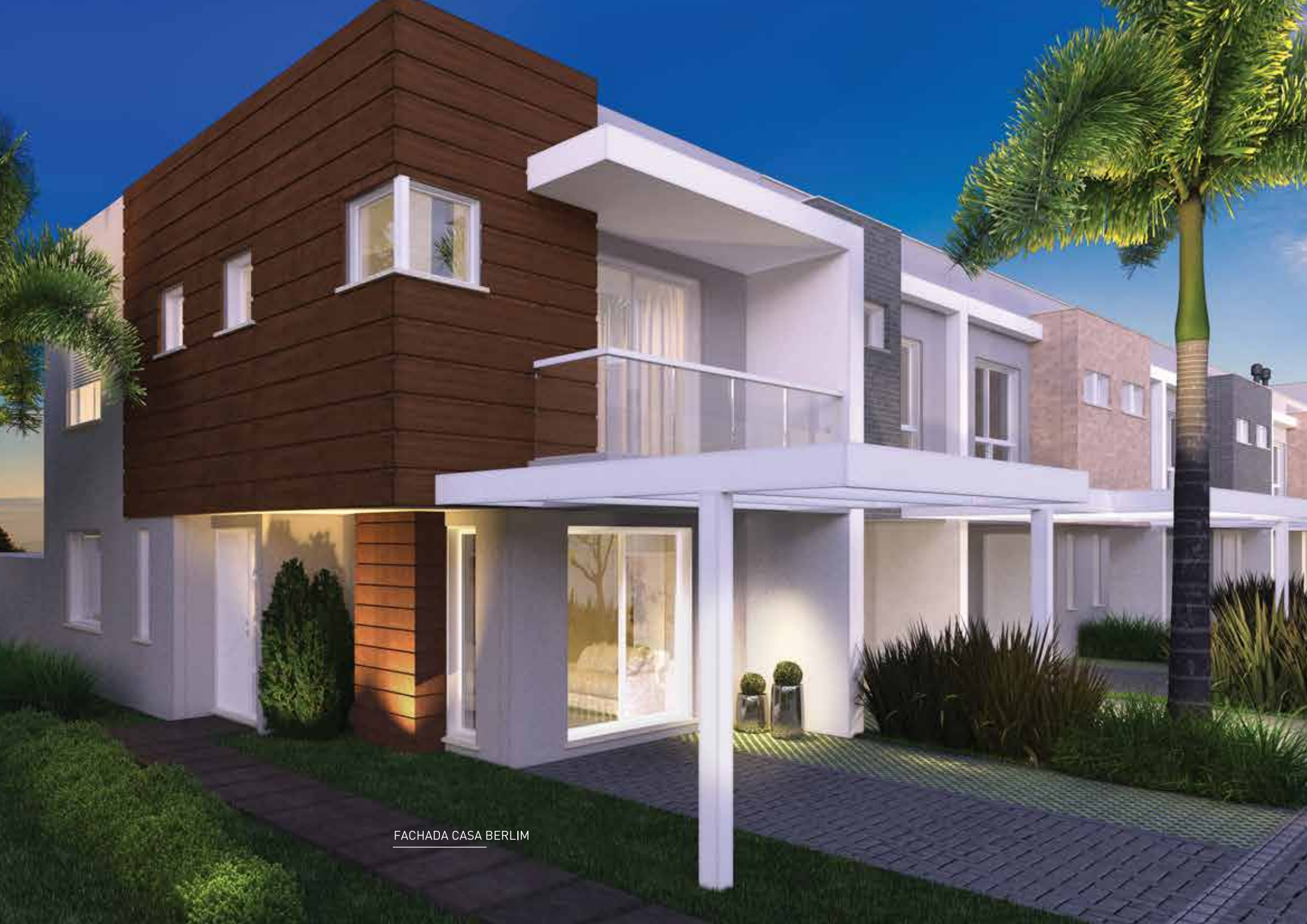
FACHADA CASA BERLIM