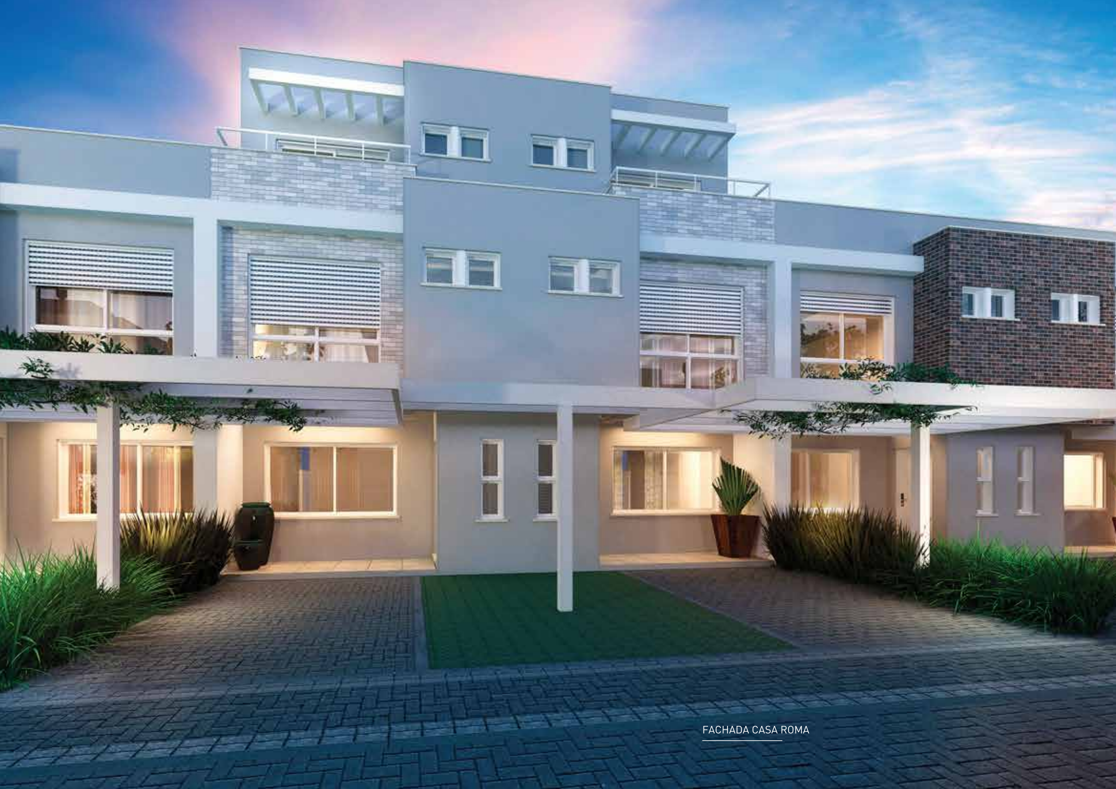
FACHADA CASA ROMA