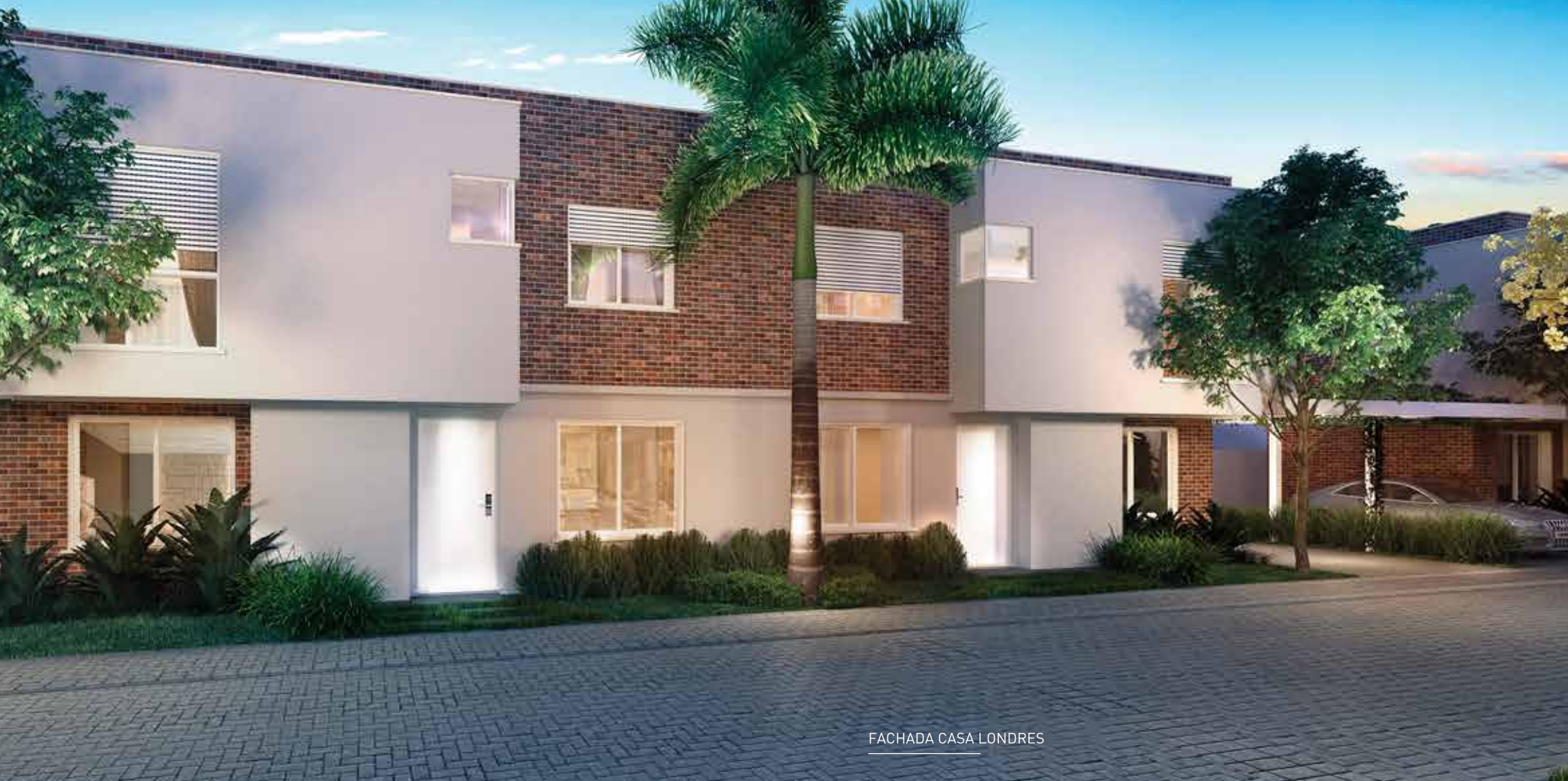
FACHADA CASA LONDRES